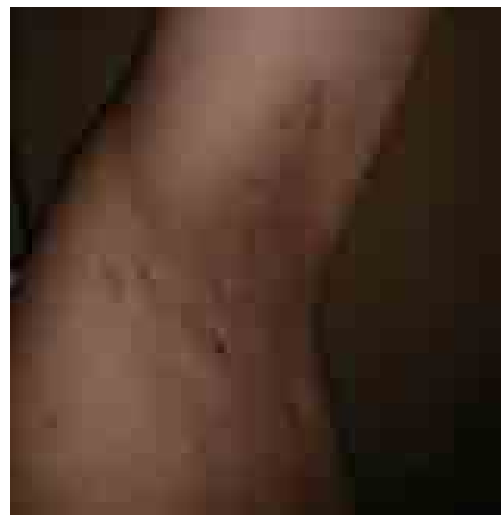
Figure 5 : Aspect post-opératoire après 23 mois d'évolution.

Au dernier recul à 23 mois postopératoires, le patient a retrouvé une fonction normale du membre supérieur gauche sans douleurs, la mobilité de l'épaule gauche était inchangée. Cette exérèse a permis la disparition des troubles neurologiques préopératoires, rappelons-le et le patient a repris normalement ses activités professionnelles, sans signes de récurrence de la tumeur (figure 5).