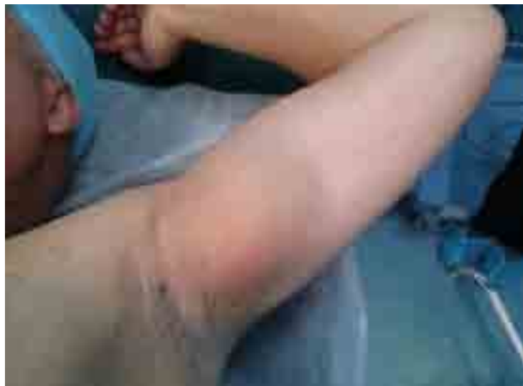
Figure 1 : Aspect clinique de la tumeur.

Cystic lymphangioma, axillary, isolated, adult, nerve compression.