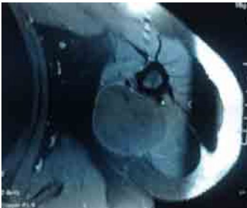
Figure 3 : Aspect IRM de la tumeur.

L'IRM a conclu en faveur d'une formation kystique de 9 cm/6 cm sans envahissement des structures adjacentes comprimant les structures nerveuses du canal huméral (figure 3).