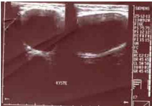
Figure 2 : L'allure kystique de la tumeur révélée par l'échographie de la région axillaire.

Il n'existe pas de troubles vasculaires. L'échographie a montré la présence d'une volumineuse tumeur d'allure kystique occupant la totalité du creux axillaire de 9 cm de grand axe (figure 2).